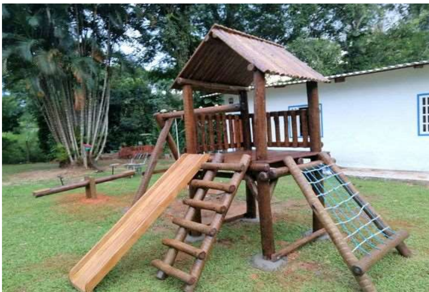
Foto Casa do Tarzan